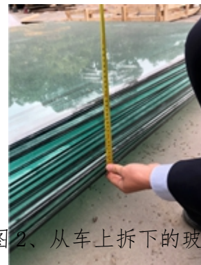
图2、从车上拆下的玻璃

冀HPQ512轻型货车北侧2米处摆放一堆长方形玻璃块，周围零散分布多条长度不等的制作木包装箱的材料木方。