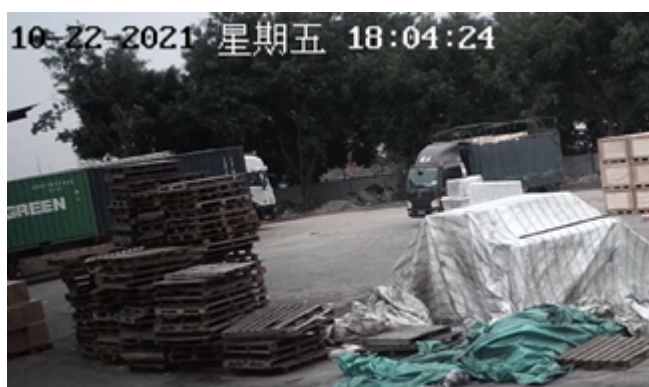
图 4、 车辆到达室外装卸区等待卸货

2021 年 10 月 19 日 11:30 时许，司玉东驾驶冀 HPQ512 轻型货车到达天津信义公司，中顺物流公司驻天津信义公司代表便引领司玉东来到门岗保卫室接受安全告知和签署《安全须知书》，之后，司玉东将车辆驶至公司装载区，由装车员史恩清安排装货，