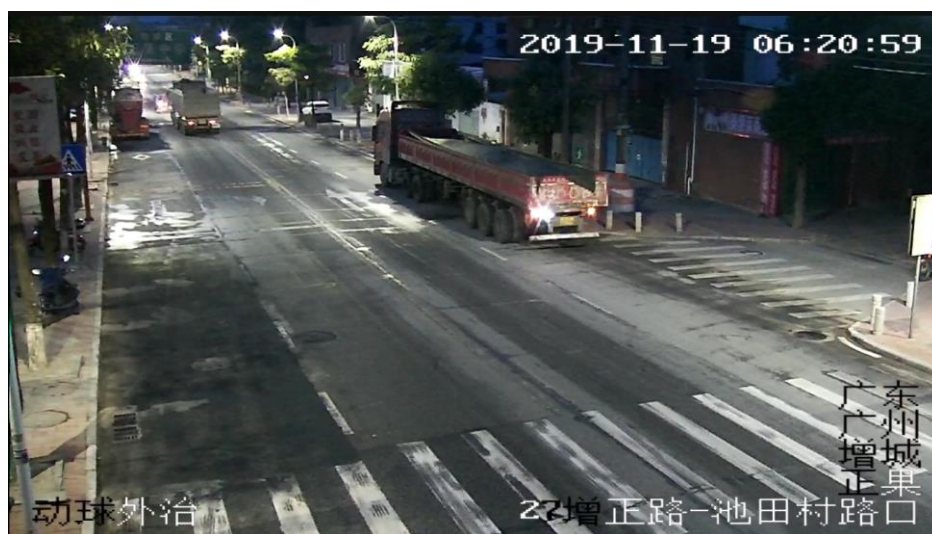
图一、赣 C3E505 号重型车越过车道分隔线（事故发生前）