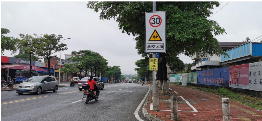
图四、事故发生路段为学校路段限速 30km/h